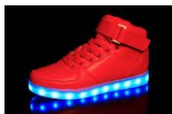
shoes ( buty)