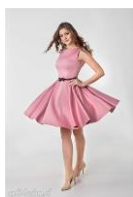
dress ( sukienka)

Sukienka-promocja, zniżka 50% -tania ☺. Teraz takie sukienki są modne. Takie spodnie każdy nosi. Są modne i zapłacisz tylko 39% ceny. Teraz dziewczynki noszą takie bluzki -kosztują 50 zł. Koszulka dla dziewczyn po 20 zł. Każde dziecko kupuje takie buty. Każda dziewczyna od 16 lat robi sobie paznokcie-teraz są takie modne za 100zł.